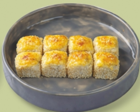
ХОККАЙДО с лососем и крабом 240 г 517