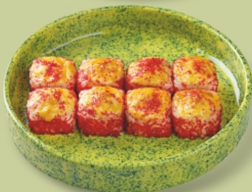
КИОТО с тигровой креветкой темпура, угрём и сыром 260 г 615