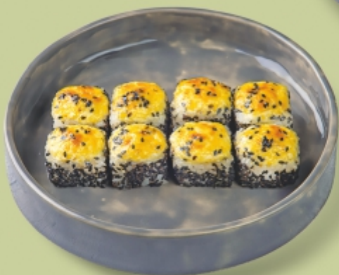
СЭНСЭЙ с краб-миксом и сыром с грецким орехом 230 г 412