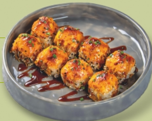
КРАБ ЧИЗ 270 г 615 с лососем, креветкой и луком фри